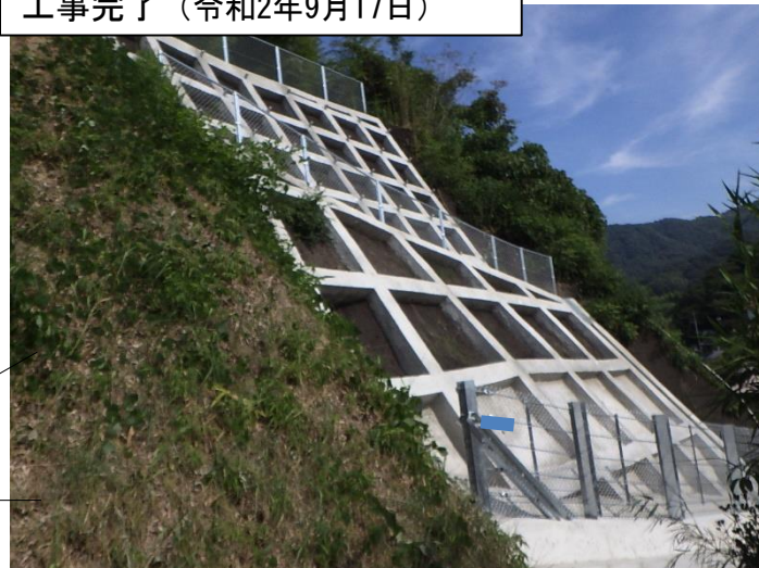
工事完了（令和2年9月17日）